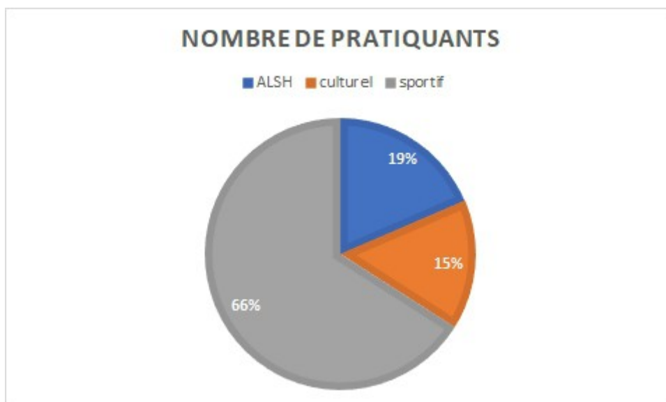
Figure 1 : proportion des adhérents et pratiquants par secteur